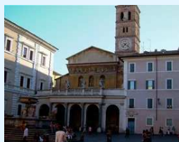
Santa Maria in Trastevere

7 - Piccola Missione per i Sordomuti e MAS in via V. Monti 3. Aggiornamenti in www.silentpoint.ensroma.it