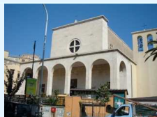
Santi Patroni d'Italia